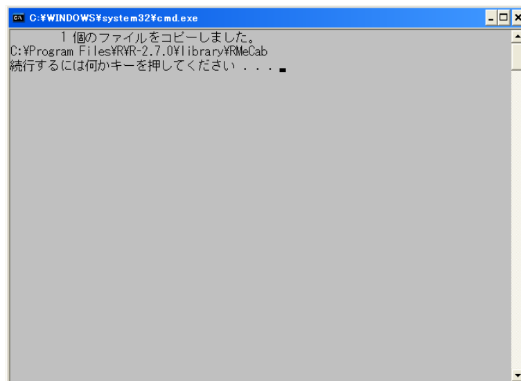
図 1-3 バッチファイル実行後のメッセージ